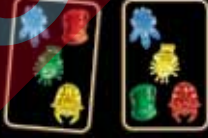
voodoo balíček kartina karta prisad

POZNÁMKA: Aspoň jedna karta musí vždy vo voodoo balíčku zostať! Ak vo voodoo balíčku nie je dostatok kariet, potiahnu si kartu iba tí hráči, ktorým to veľkosť balíčka umožňuje. Ostatní hráči tento raz vyviaznu bez penalizácie. Po potiahnutí kariet sa hráči opäť chopia svojich na chvíľu odložených kariet. Hráč, ktorý zvolal „Voodoo!“, teraz znova spustí hru zvolaním „Voodoo mánia!“.