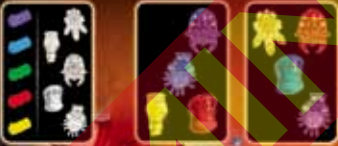
karty prisad (rub a líc)

Teraz má každý hráč vlastný balíček kariet prisad (ďalej označovany aj ako „ťahací balíček“), z ktorého si na ruku vezme 3 vrchné karty prisad. Zvyšné karty prisad i prehladu vrátite naspäť do škatulky. Počas hry ich už nepotrebuje.