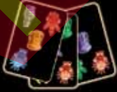
karty, ktoré má na ruke Petrov