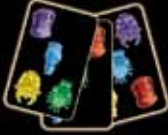
karty, ktoré má na ruke Kaitin